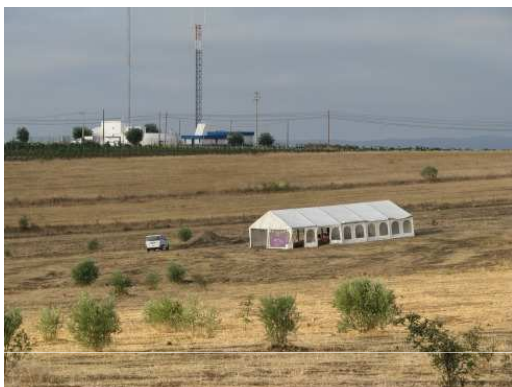
Localização da área de intervenção do NIA em 2009.

Em 2009, o Núcleo de Investigação Arqueológica (NIA) da Era Arqueologia S.A. iniciou escavações na área central do complexo de recintos dos Perdigões.