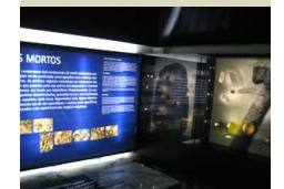
Exposição dos Perdigões na torre medieval da Herdade do Esporão (Reguengos de Monsaraz)