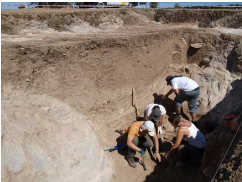
Trabalhos de escavação no Fosso 1

Esta primeira intervenção da equipa de Málaga (que continuará no próximo ano) insere-se, pois, na ambição de trazer diferentes investigadores (e respectivos projectos de investigação) a colaborar no programa INARP, permitindo, neste caso, ensaiar formas de interacção entre equipas distintas em simultâneo no terreno.