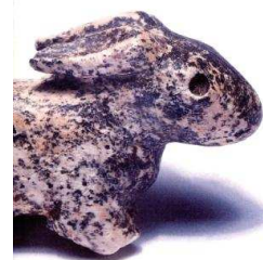
PERDIGÕES COMPLEXO ARQUEOLÓGICO Núcleo Expositivo da Torre do Esporão ARCHAEOLOGICAL COMPLEX The exhibition at Torre do Esporão