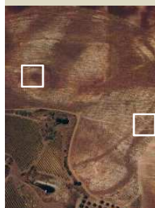
Áreas das intervenções de 2009